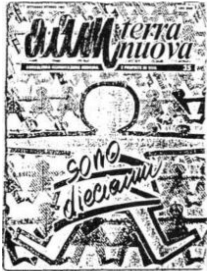
AAM Terra Nuova, c.p.2- 50038 Scarperia' (Fi).

proletariato. Attraverso la meritocrazia, che nella gestione del pubblico danaro si rovescia In consorzeria, oggi il capitale alimenta tali contrasti. E' questa una strategia che la sinistra deve saper battere, incorporando i temi e le problematiche di quelle sub-economie regionali sulle quali si abbatte incessantemente l'onda lunga del mercato. A questo riguardo è necessario affermare il concetto che - se un mercato regolato non può certamente puntare a frenare "il progresso", (non potendosi realisticamente chiedere livelli di autarchia più pesanti di quelli che la CEE già si è dati) - in un mercato guidato dalla programmazione non potrà certamente essere il tasso di sconto la discriminante del progresso. Se la funzione di sovvenire con il credito gli investimenti e l'impresa diventa una funzione politica, la misura del tasso di sconto dovrà essere determinata intuitus personae al fine di gestire la transizione settore per settore, azienda per azienda. Soltanto su una solida base materiale che tenda ad eliminare le punizioni mercantili ai danni dei compartimenti più deboli della merce-lavoro, potrebbero porsi le basi per un cambiamento della cultura dei bisogni che, come ha ben messo in luce Agnes Heller, dovrebbe essere il fatto più qualificante della società socialista, e che comunque la prepara e la sostiene.